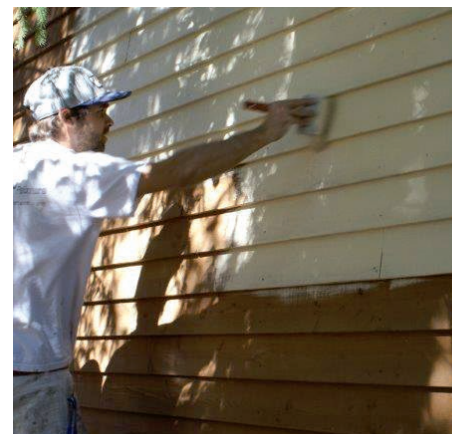
PHOTO 1 - APPLICATION DE LA PREMIÈRE COUCHE (TEINTURE OPAQUE) SUR LAMBRIS POSÉ À L'HORIZONTALE.

Une échelle pourrait être nécessaire pour rejoindre quelques endroits restreints.