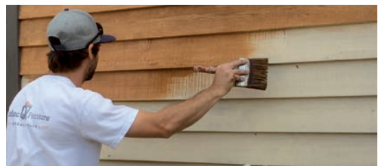
PHOTO 3 - APPLIQUEZ LA 2 ÈME COUCHE ÉGALEMENT ET BROSEZ AFIN D'UNIFORMISER LA TEINTURE.

Les patrons d'application à suivre sont les mêmes que ceux de l'application de la 1 ère couche (teinture opaque). Voir la section précédente pour tous les détails. Assurez-vous de :