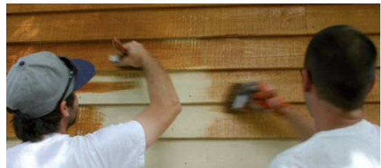
PHOTO 2 - UN REBORD MOUILLÉ DOIT TOUJOURS ÊTRE PRÉSENT